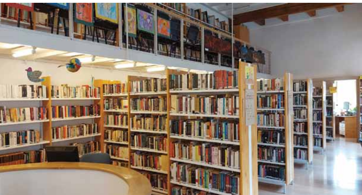
7. ábra: A könyvtár szabadpolcos része napjainkban