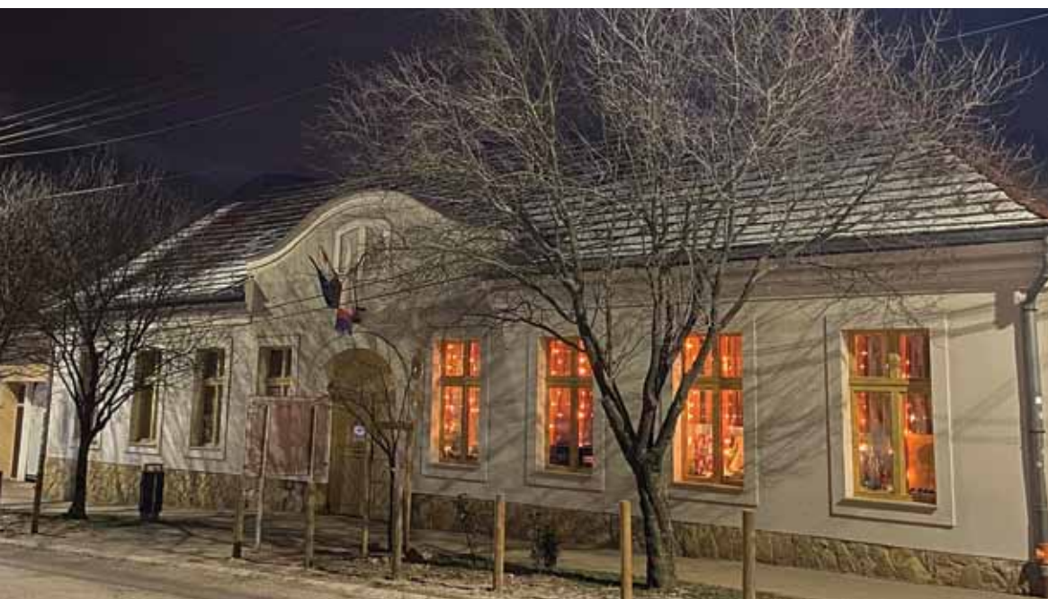
8. ábra: Az Öregiskola Közösségi Ház és Könyvtár homlokzata 2023 januárjában