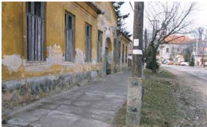
6. ábra: Az Öregiskola homlokzata 1996-ban

Érdemi megállapodás nem született. Feltételezhető, hogy a vevő- és bérlőjelöltek tökeereje és az eladási szándék nem tudott egymásra találni. Már csak azért sem, mert a kilencvenes évek második felétől egyre erősödtek azok a hangok, amelyek az Öregiskolát egyértelműen „belső” ügynek mondták. Az 1994-es helyhatósági választási kampányban már minden induló platform foglalkozott az üggyel. Láthatóvá váltak azok az erők, amelyek egyértelműen elköteleződtek a hasznosítás (nem a bontás!) mellett, és a kulturális célú hasznosítás került a tervek középpontjába. A lakossági elvárások is feléle mutattak. A közvélekedés tehát egységes lett, egy dolog hiányzott a tervek, a közös cél megvalósításához: a forrás.