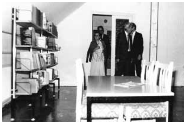
5. ábra: Olvasóterem az Általános Művelődési Központban, 1981

Nagykovácsiban 1977 telén még nagykabátban tanították a gyerekeket. Az akkori tanácsvezetés vállalta, hogy megépíti a komplex intézményt, ahol végre legalább nem fáznak, de ennek az lett volna a feltétele, hogy a tanárok vállalják, hogy a közművelődés letéteményesei is lesznek. A nemzetközi trendektől ez a rögválóságon nyugvó alku elég távol állt, és nem is működött sokáig.