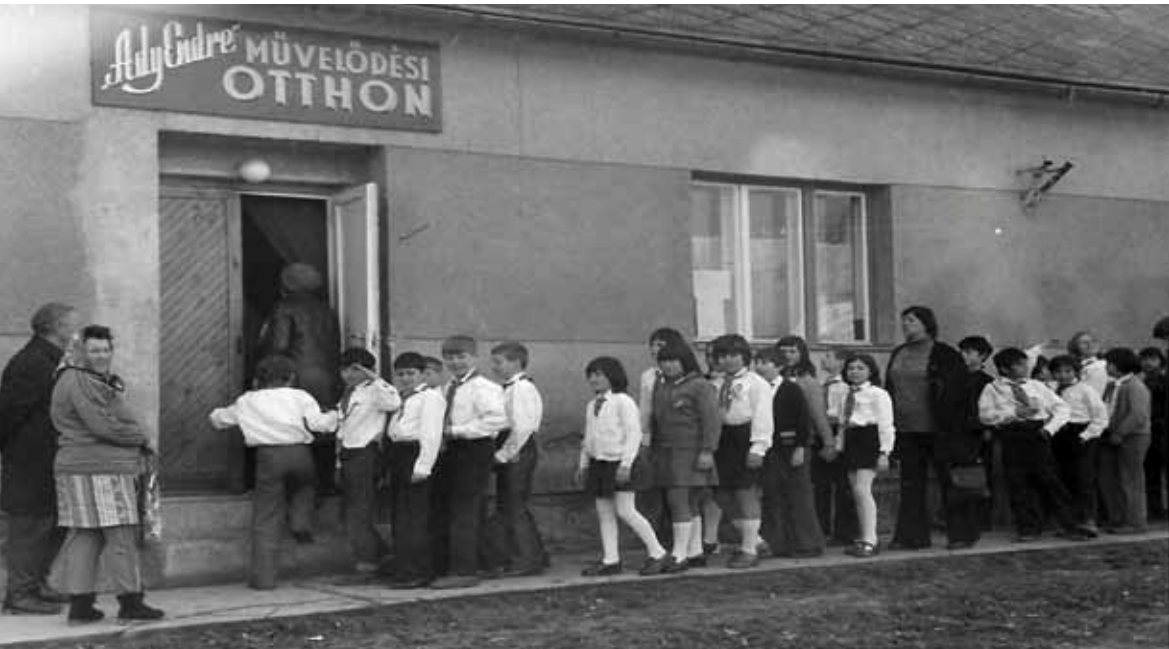
4. ábra: Az Ady Endre Művelődési Otthon, 1977

Forrás: B. Szatmári Lajos (szerk.): Községi krónika , 1977. Kézirat. 546.