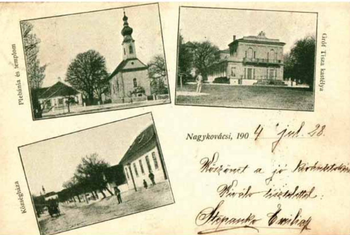
2. ábra: Képeslap a község házával, 1904

Elgondolkodtató, miért gondolta feladatának a földművelődésügyi miniszter, hogy könyvtárat alapítson Nagykovácsiban? 1902-ben Darányi Ignác töltötte be a pozíciót. Még az életrajzi lexikon műfajának megfelelő rövid leírása is a jelentős cselekedetei között említi, hogy népkönyvtárakat létesített. Tehát nem egyedi jelenséggel állunk szemben, hanem mozgalom részeként létesült könyvtár a településen. A Budapesti Hírlap 1901. december 25-i száma pontosan ezer népkönyvtár létrehozásáról ad hírt. „A karácsonyi ünnepek során látván a betű győzedelmét, azt a derűs, lelket nemesítő hatást, melyet Darányi kulturfegyverével elért: igaz elismeréssel üdvözljük azt az államférfiut, a ki ezt a kulturtényezőt tárcája egyik sikert látott agendájává tette.” 9 1902 karácsonyán ugyanez a lap már 1200 népkönyvtárról tudósít, amelyben már benne volt a mi könyvtárunk elődje is, a 20 koronás szekrényvel és az 50 koronás alapítványi támogatással. 10